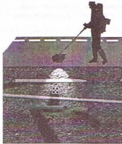
Рис. 1. Локализация инженерных сетей с помощью георадаров

Принцип георадарного метода основан на посылке и приеме высокочастотного радиосигнала, отраженного от подземных объектов (напр., инженерных сетей) и границ геологической среды. Импульсный сигнал источника сигналов частотой 10–1000 МГц излучается передающей антенной на земную поверхность, после чего, измеряется время возвращения отраженных радиоволн. В настоящее время имеются георадары, которые неспособны достаточно точно локализовать инженерные сети под земной поверхностью.